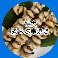
特大 煮つぶ串焼き